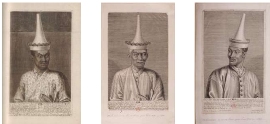
▲ Jean Hainzelmann, Les premier, deuxième et troisième ambassadeurs siamois , 1686, Château de Versailles

CHACQUE DÉLÉGATION APPORTE À VERSAILLES LA VARIÉTÉ DU MONDE et provoque en retour autant de modes. Les cadeaux échangés à l'occasion de ces ambassades, comme à l'occasion des visites princières, constituent autant de témoignages du faste de la cour de France, suivant les barèmes précis du ministère des Affaires étrangères ou les choix plus personnels des souverains eux-mêmes.