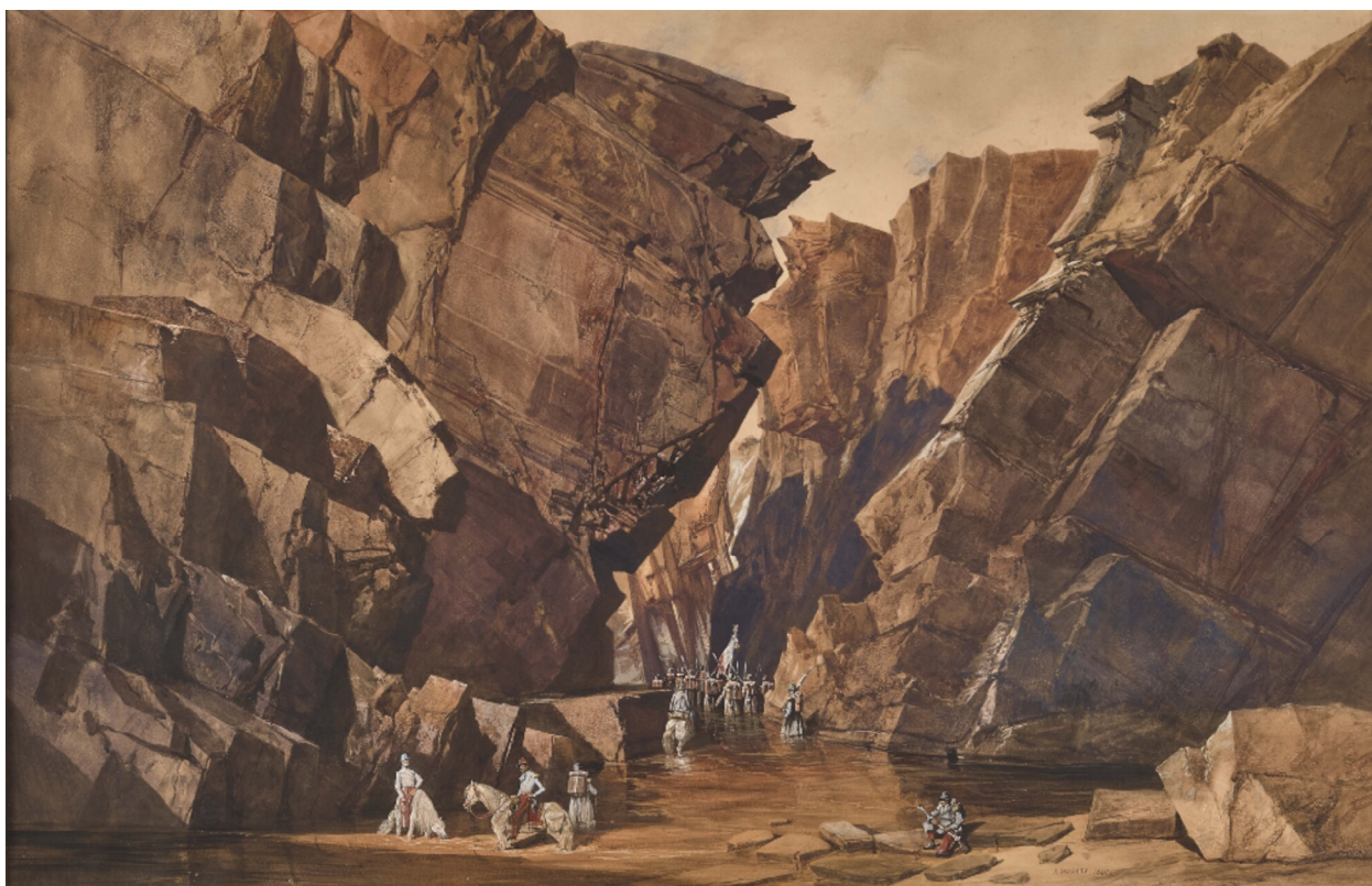
Adrien Dauzats Troisième muraille des Portes-de-Fer. Les chasseurs du 3ème régiment et les soldats du 2ème de ligne descendent dans le lit du ruisseau, 28 octobre, 1840 Aquarelle et gouache sur papier, 63 x 97 cm Versailles, musée national des châteaux. MV 2665

La Troisième muraille des Portes de fer fait partie d'un ensemble d'œuvres aquarellées qui devait témoigner de cette fantastique épopée de l'armée française dans un territoire hostile. La composition de Dauzats permet d'utiliser pleinement le potentiel dramatique de la scène. Les parois rocheuses à l'intérieur desquelles évoluent les soldats, inscrivent l'œuvre de Dauzats dans le thème romantique de l'homme face aux forces de la nature.