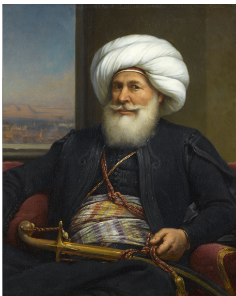
Auguste Couder Mehemet-Ali, vice roi d'Egypte , 1841 Huile sur toile, 92,5 x 76 cm Versailles, musée national des châteaux.MV 4845

À partir du portrait de Mehemet-Ali, vice roi d'Egypte, il pourra être analysé avec les élèves de quelle façon l'Orient se manifeste et se caractérise dans la peinture de Couder.