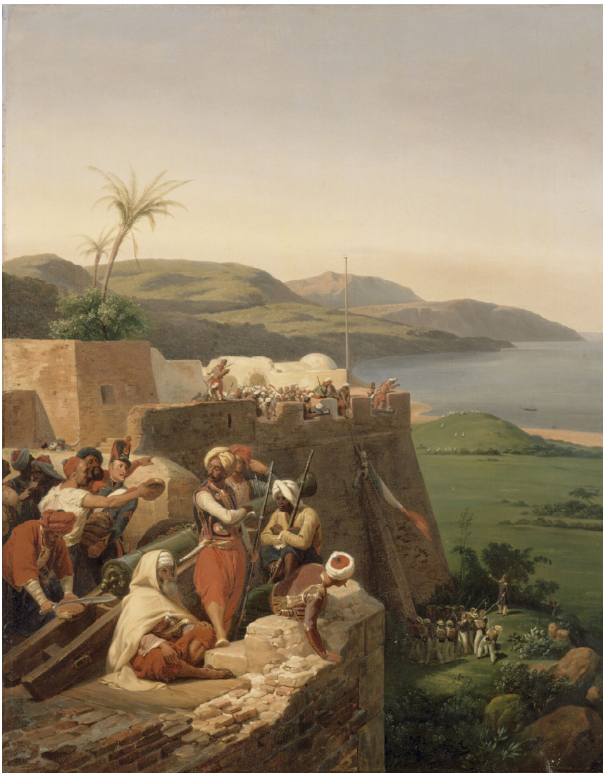
Horace Vernet Prise de Bône, 27 mars 1832, 1836 Huile sur toile, 90 x 71 cm. MV 1821

La confrontation avec la civilisation orientale, simplifiée par l'amélioration des liens diplomatiques et économiques, a conduit les peintres à s'intéresser plus volontiers à la réalité de ces pays. Devant l'influence croissante de la colonisation, de nombreux artistes ont voulu témoigner et contribuer à rendre compte de la réalité de ces pays tel que l'Algérie. Les tableaux orientalistes ont non seulement séduit leurs contemporains, mais ils ont surtout enrichi le regard des occidentaux sur l'Orient.