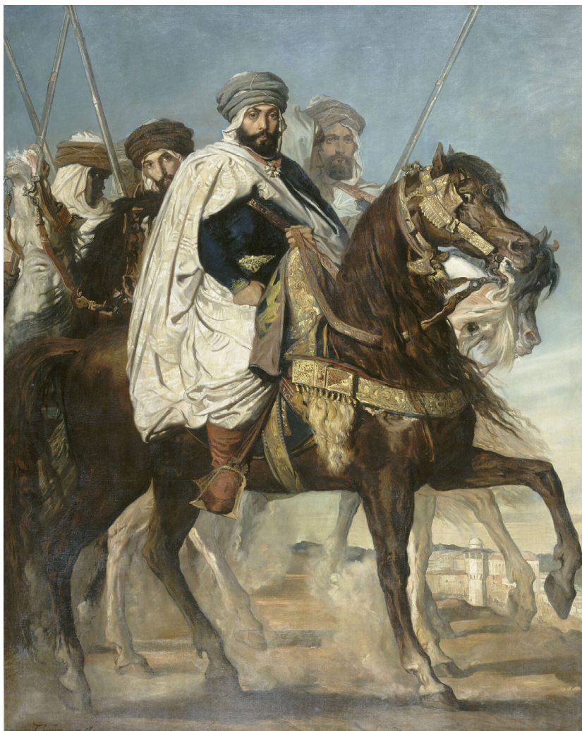
Théodore Chassériau Ali Ben Ahmed et son escorte devant Constantine , 1845 Huile sur toile, 325 x 260 cm Versailles, musée national des châteaux. MV 5407

Dans la pure tradition du portrait équestre, Chassériau représente le calife sur sa monture dans une attitude digne et conquérante aux côtés de son escorte. Rien n'a été laissé au hasard. La richesse du pays conquis est révélée par les vêtements des personnages et les multiples accessoires représentés : broderies d'or, tuniques de velours et de soie. Il en est de même pour l'harnachement de la monture du calife dont le décor luxueux contribue à magnifier le personnage.