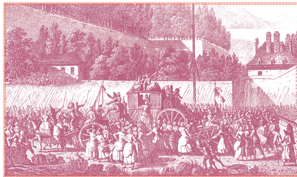
La foule en route pour aller chercher le Roi à Versailles, le 5 octobre 1789.