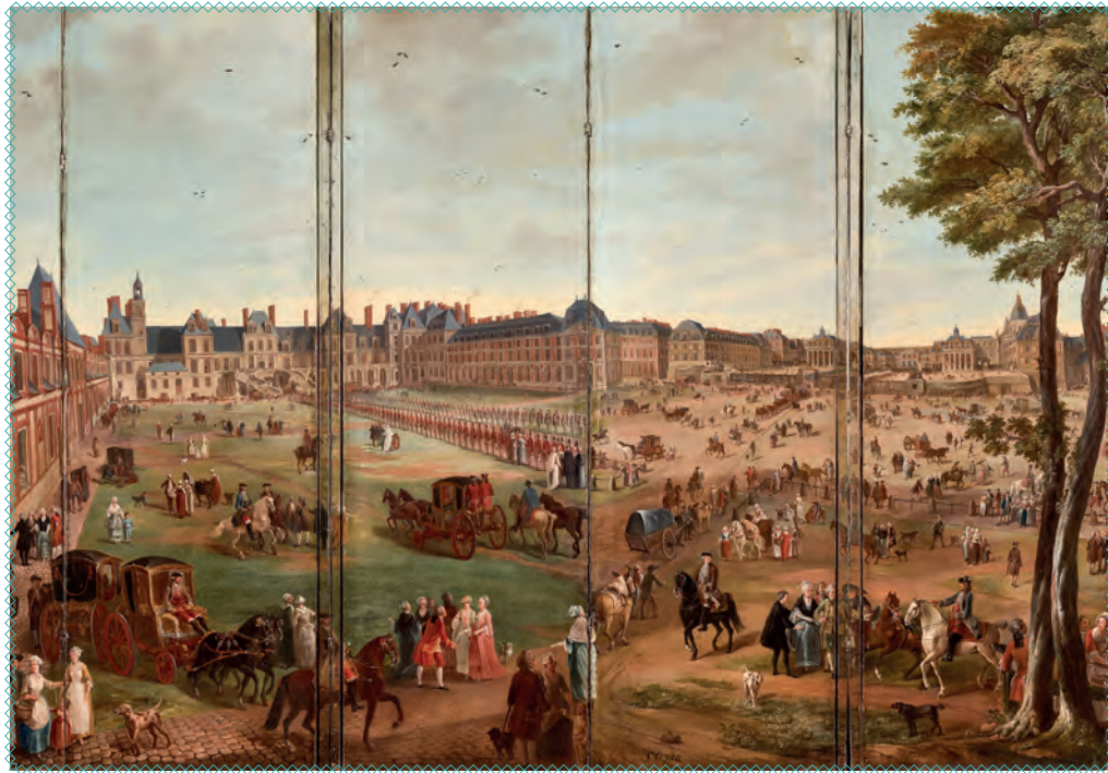
Paravent avec vue de Versailles.