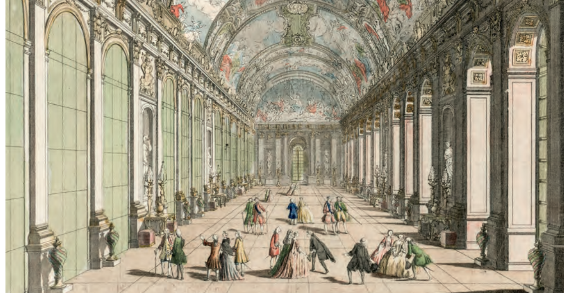
Vue d'optique représentant la Grande Galerie qu'on appelle aujourd'hui la galerie des Glaces de Versailles.