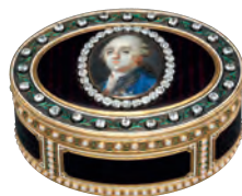
Cadeaux reçus et offerts : cabinet japonais, tabatière à l'effigie du Roi et tasse et soucoupe à l'effigie de Mohammed Osman Khan.