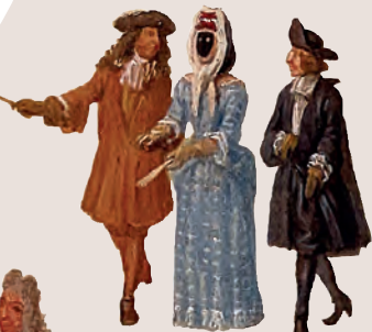
Détails tirés du Bassin du Miroir d'Eau et l'Isle royale d'Etienne Allegrain.