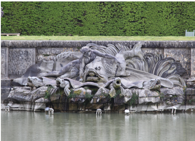
Protée © Molly Casey

Ce bassin reste aujourd'hui le clou du spectacle des Grandes Eaux du Château de Versailles. Il constitue le bassin pour lequel le débit d'eau est le plus important et... le plus impressionnant.