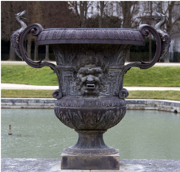
Vase de plomb du Bassin de Neptune

En outre, 44 jets d'eau d'une hauteur de 21 mètres accentuent encore la grandeur du lieu. Ils sont surplombés par la colonne d'eau du Dragon d'une hauteur de 27 mètres située au-dessus du bassin, vers l'Allée d'eau. La première mise en eau du bassin de Neptune a lieu en 1685, sous le regard satisfait de Louis XIV. Le bassin est alors considéré comme un chef-d'œuvre de l'hydraulique des jardins.