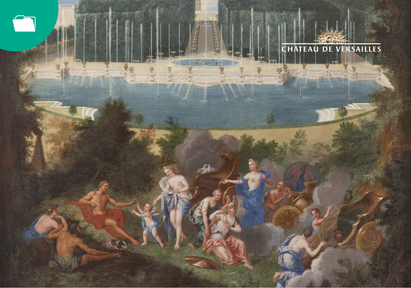
Vue du Bassin de Neptune et de l'Allée d'eau, détail, par Jean Cotelle, 1685. Huile sur toile, 449×641 cm.