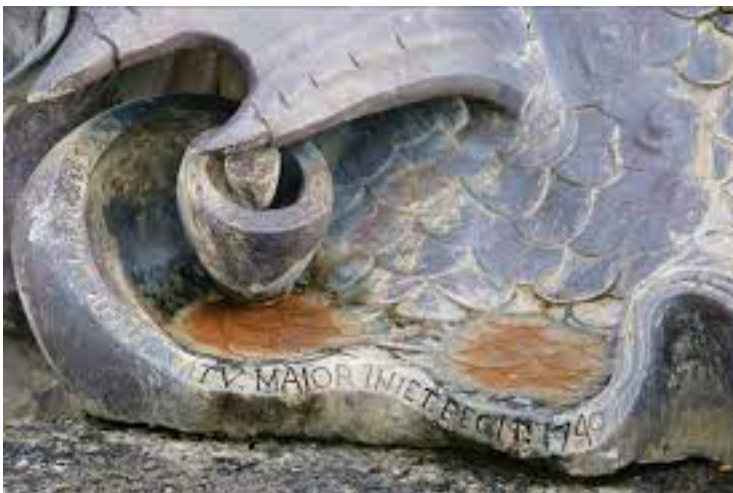
Signature de l'artiste © F. Larrieu

Le dieu Océan, le père de tous les fleuves et le maître des Océans, est étendu sur une licorne marine au milieu de roseaux et de poissons. Sur le devant, un crabe dévore un serpent. Le dieu est représenté tout en volume et en mouvement grâce au travail sur le drapé, montrant ainsi la puissance de l'art baroque et le savoir-faire de Lemoyne qui réalise cette sculpture en 1740.