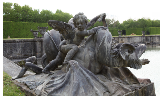
Amours chevauchant un dragon marin © Molly Casey