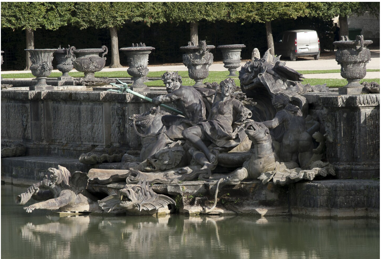
« Le triomphe de Neptune et Amphitrite »

Le groupe met en scène le puissant dieu des mers, Neptune, reconnaissable à son trident, et son épouse Amphitrite, qui reçoit une branche de corail, sur leur trône maritime constitué d'une vaste coquille de 23 pieds d'étendue sur 14 de haut. Le couple règne sur l'océan mythologique que constitue le bassin. Leur triomphe est symbolisé par l'ange jouant de la conque devant la coquille. Ils sont entourés de Néréides, de Tritons et de Dauphins. Les deux parties de la coquille se terminent en conques et sont ornées de rocaille. L'ensemble, marqué par le mouvement, s'intègre parfaitement au bassin et à ses jeux d'eau.