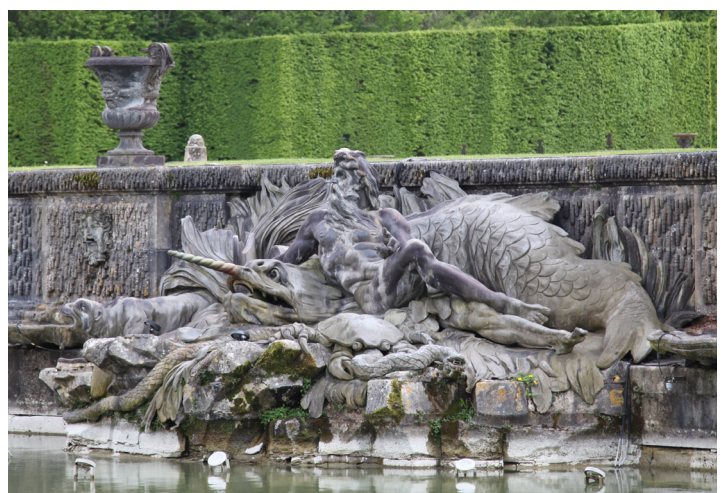
Océan © Molly Casey