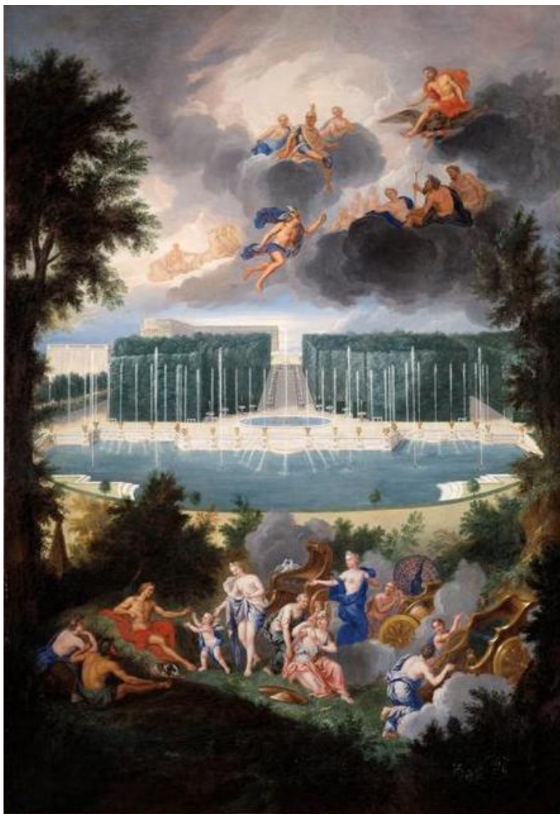
Vue du Bassin de Neptune et de l'Allée d'eau, détail, par Jean Cotelle, 1685. Huile sur toile, 449x641 cm.

Ce sont Le Nôtre puis Hardouin-Mansart qui donnent au Bassin de Neptune sa forme d'amphithéâtre. Cette forme particulière, dictée par la position même du bassin, permet au spectateur de faire un tour complet et, ainsi, de changer de point de vue sur le château qui s'offre alors au regard. On clôt ainsi la perspective ouverte par l'axe Nord-Sud. Cette vue a été immortalisée par Jean Cotelle en 1685 dans ce tableau mythologique :