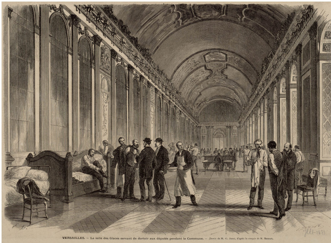
La galerie des glaces servant de dortoir aux députés pendant la Commune, Estampe, Dumont, Louis-Paul-Pierre (graveur) Janet, Gustave (dessinateur) Bocourt, Etienne-Gabriel (dessinateur). INV.GRAV 4927