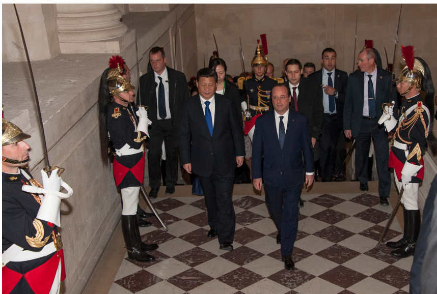
Visite d'état du Président chinois, MM. Hollande et Xi Jinping montant l'escalier Gabriel, 27 mars 2014

La III e République n'hésite pas non plus à utiliser Versailles, où elle est née, pour recevoir les chefs d'État étrangers. Le 8 juillet 1873, le Président Mac-Mahon offre un grand dîner, toujours dans la galerie des Glaces, en l'honneur du Shah de Perse. Cet événement est d'autant plus important qu'à cette époque la France souffre d'un isolement diplomatique réel, organisé par le Chancelier Bismarck au détriment de la France après la défaite de 1870. Cet isolement diplomatique est progressivement rompu au cours des années 1890 grâce aux efforts de la France pour se rapprocher de la Russie. En 1896, Félix Faure, surnommé le « Président Soleil » en raison de son goût pour le faste, reçoit en grande pompe à Versailles le tsar de Russie, Nicolas II, afin de sceller l'alliance franco-russe. À cette occasion, la galerie des Batailles est métamorphosée en un immense et impressionnant salon de réception.