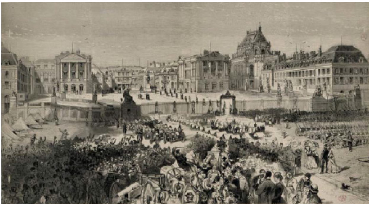
Episode de la Commune : arrivée à Versailles sur la place d'armes des pièces d'artillerie prises aux insurgés, 1871, Daudenarde, Louis-Joseph-Amédée (graveur) Urrabieta Ortiz y Vierge, Daniel dit Vierge (dessinateur) INV.GRAV 5425.

(Léonce Dupont, Souvenirs de Versailles pendant la Commune, E. Dentu, Paris, 1881, p. 85)