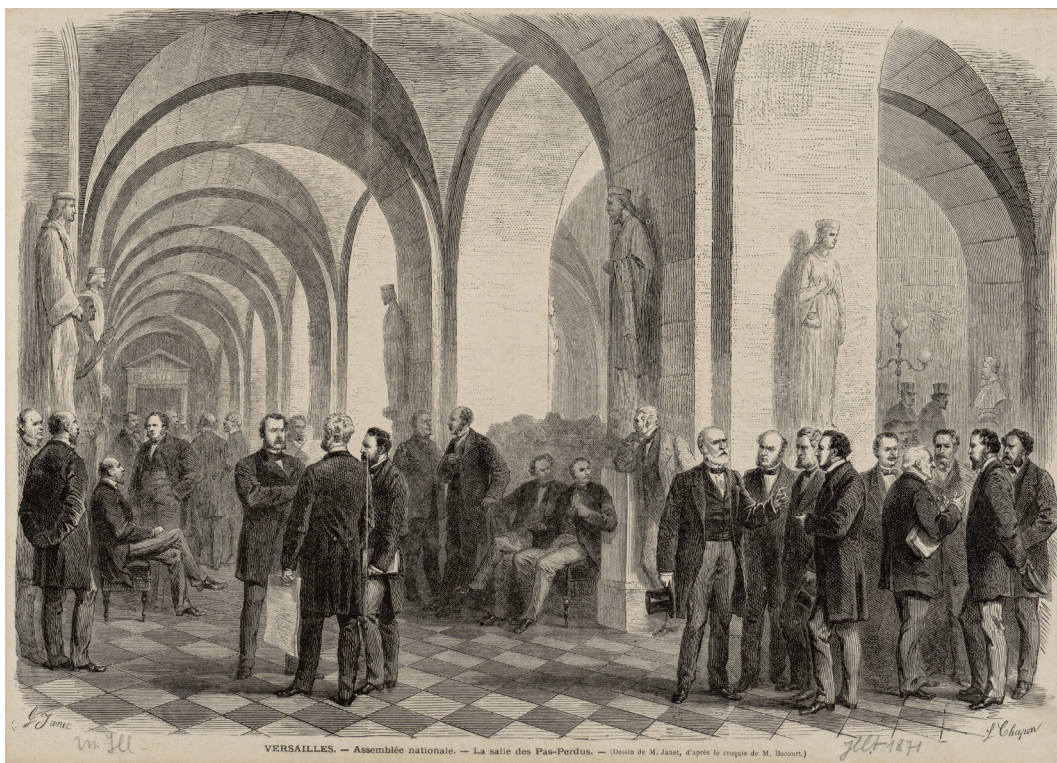
Les députés de l'Assemblée nationale réunis dans le chateau de Versailles en 1871, Chapon, Léon-Louis (graveur) Janet, Gustave (dessinateur) croquis d' Bocourt, Etienne-Gabriel (dessinateur), INV.GRAV 5418