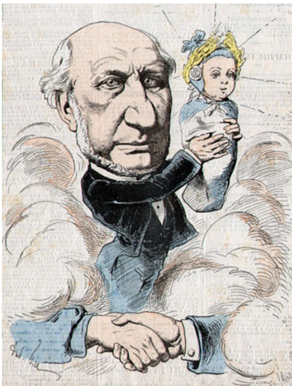
Henri Wallon, sortant des nuées, présente le bébé Constitution, coiffé du bonnet phrygien. (L'Eclipse du 6 mars 1875)

Dès lors, la République, la fonction du président de la République, et le septennat, entrent dans les lois constitutionnelles de la France. L'Assemblée adopte le 24 février 1875, la loi relative à l'organisation du Sénat puis celle relative à l'organisation des pouvoirs publics, et enfin, le 16 juillet, la loi sur les rapports entre pouvoirs publics, qui forment toutes les trois la Constitution de 1875.