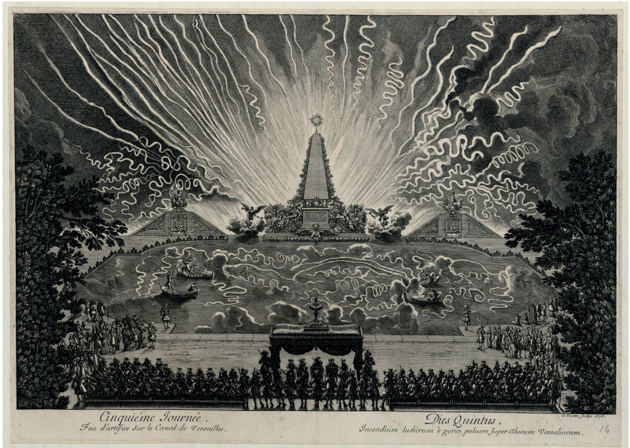
Divertissements de Versailles (1674). Cinquième journée. Feu d'artifice sur le canal de Versailles.

Historien et critique d'art. Secrétaire d'ambassade à Rome auprès du marquis de Fontenay-Mareuil, il se lie avec Poussin, puis devient en 1666 historiographe du roi et de ses bâtiments, arts et manufactures de France et, en 1671, secrétaire de l'Académie d'architecture. Parallèlement à ses diverses fonctions, il donne des descriptions des fêtes royales, de Versailles et des collections de la couronne. Considéré comme un des principaux théoriciens du classicisme, Félibien est notamment l'auteur d' Entretiens sur les vies et les ouvrages des plus excellents peintres anciens et modernes (1666-1688).