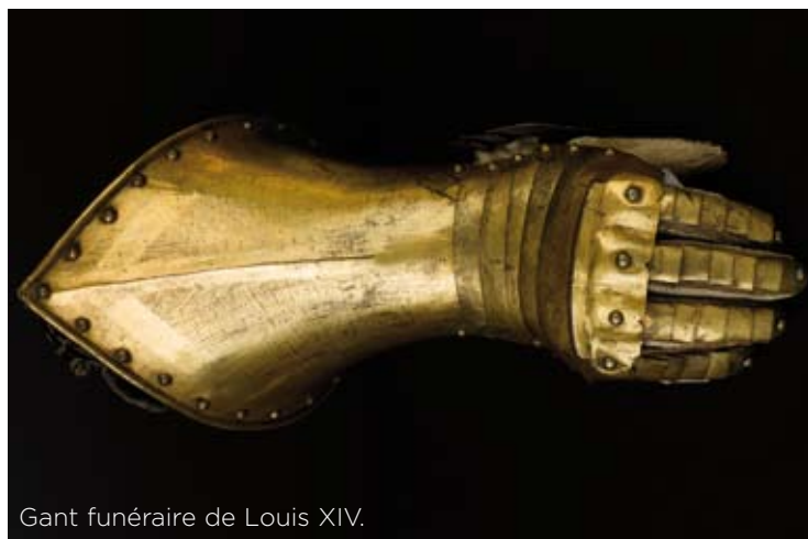
Gant funéraire de Louis XIV.

Il quitte Versailles à 19 heures et arrive à l'abbaye de Saint-Denis à 7 heures. Des milliers de personnes, des civils, des militaires, des religieux, des courtisans et des membres de la famille royale suivent le cercueil. Un groupe de pauvres gens portant des torches ferme la marche. Ce trajet de nuit symbolise la résurrection (le fait de revenir à la vie) après la mort. Le cercueil reste 43 jours dans la basilique, le temps de préparer les funérailles. Des messes sont données en permanence, et on sonne le glas (les cloches) 3 fois par jour pour rappeler la mort du roi. Les funérailles ont lieu le 23 octobre dans la basilique richement