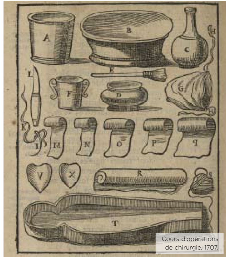
Cours d'opérations de chirurgie, 1707.

Si l'on connaît aujourd'hui aussi bien le déroulement de ces opérations, c'est parce que les nombreuses personnes qui y ont assisté ont laissé des témoignages. Les médecins ont rédigé des comptes rendus, et les principaux officiers de la cour ont retranscrit ces faits dans les registres du royaume.