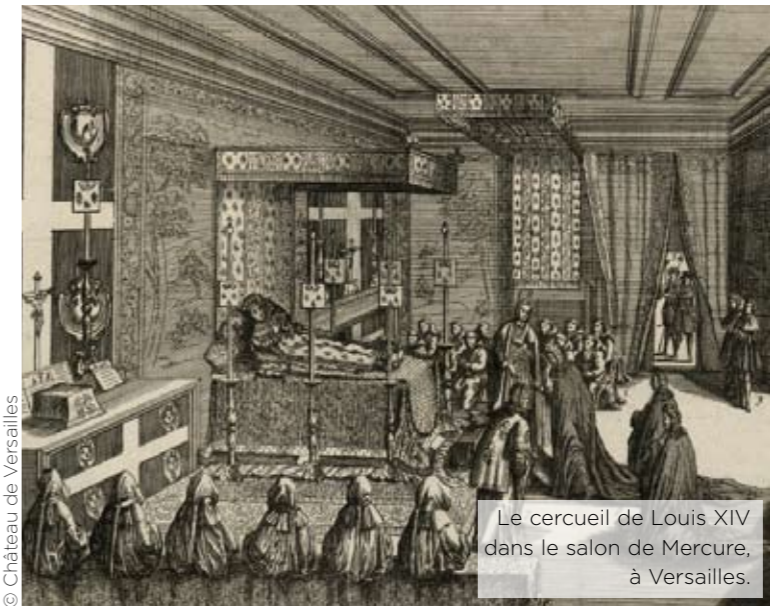
Le cercueil de Louis XIV dans le salon de Mercure, à Versailles.