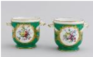
Manufacture royale de Sèvres, seaux « à liqueur » ronds à fond vert, 1773, porcelaine tendre, Château de Versailles