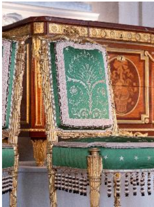
Vue de l'exposition « Le Comte d'Artois, prince et mécène » section « Le prince chez lui : Versailles et le palais du Temple » 19