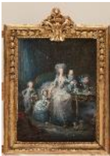
Charles Le Clercq, La Comtesse d'Artois et ses enfants , 1783, huile sur toile, Château de Versailles