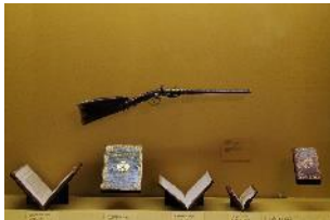
Vue de l'exposition « Le Comte d'Artois, prince et mécène » section « Un prince français » 7