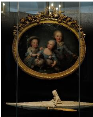
Vue de l'exposition « Le Comte d'Artois, prince et mécène » section « Un amateur de curiosités » 8