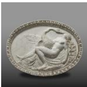
Léda et Jupiter métamorphosé en cygne , XVIII e siècle, marbre, Château de Versailles