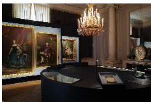
Vue de l'exposition « Le Comte d'Artois, prince et mécène » section « La jeunesse d'un prince » 3