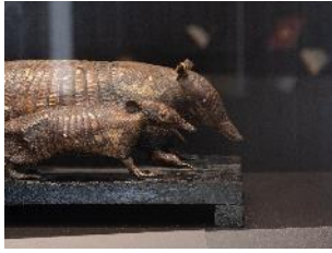
Vue de l'exposition « Le Comte d'Artois, prince et mécène » section « Un amateur de curiosités » 10