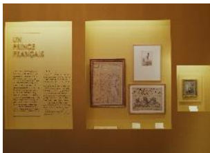
Vue de l'exposition « Le Comte d'Artois, prince et mécène » section « Un prince français » 6