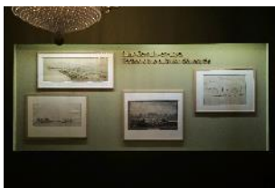
Vue de l'exposition « Le Comte d'Artois, prince et mécène » section « Un prince bâtisseur » 12