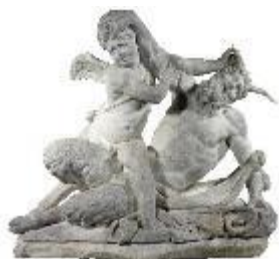
Amour combattant un satyre , XVIII e siècle, marbre, Château de Versailles