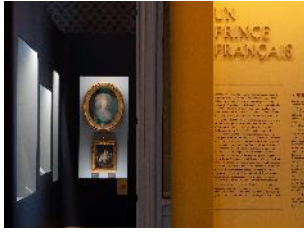
Vue de l'exposition « Le Comte d'Artois, prince et mécène » sections « La jeunesse d'un prince » et « Un prince français » 4