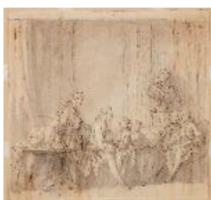
Charles Monnet, Le Dauphin, fils de Louis XV, donnant la leçon à ses trois enfants , vers 1765-1770, pierre noire, plume et encre brune sur papier, Château de Versailles V.2019.31