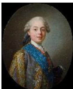
Louis Michel Van Loo, Charles Philippe de France, comte d'Artois , 1770, huile sur toile ovale, Château de Versailles