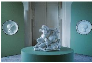
Vue de l'exposition « Le Comte d'Artois, prince et mécène » section « Maisons : le retour des sculptures » 24