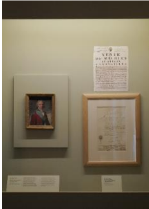
Vue de l'exposition « Le Comte d'Artois, prince et mécène » section « 1789 : l'exil » 22