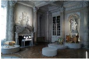
Vue de l'exposition « Le Comte d'Artois, prince et mécène » section « Le prince chez lui : Versailles et le palais du Temple » 17