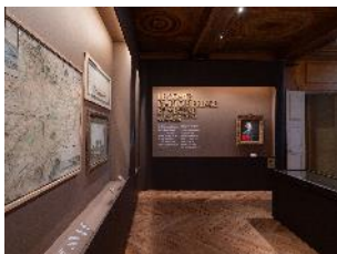
Vue de l'exposition « Le Comte d'Artois, prince et mécène » section « Le comte d'Artois et le château de Maisons » 1