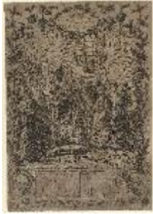
André Basset dit le Jeune, Mariage de Charles Philippe de France, comte d'Artois et de Marie-Thérèse de Savoie, le 16 novembre 1773 , estampe sur papier, Château de Versailles