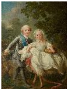
François Hubert Drouais, Charles Philippe de France, comte d'Artois, et sa sœur Marie-Adélaïde-Clotilde de France, dite Madame Clotilde , 1763-1764, huile sur toile, Château de Versailles