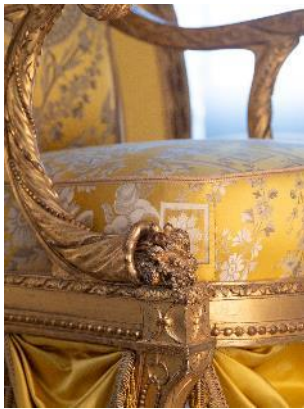
Vue de l'exposition « Le Comte d'Artois, prince et mécène » section « Le prince chez lui : Versailles et le palais du Temple » 20