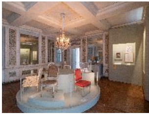
Vue de l'exposition « Le Comte d'Artois, prince et mécène » section « 1789 : l'exil » 23