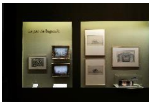
Vue de l'exposition « Le Comte d'Artois, prince et mécène » section « Un prince bâtisseur » 13