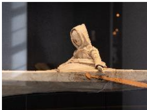
Vue de l'exposition « Le Comte d'Artois, prince et mécène » section « Un amateur de curiosités » 9