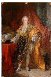
Antoine François Callet, Philippe de France, comte d'Artois, en costume de l'ordre du Saint-Esprit , Salon de 1779, huile sur toile, Château de Versailles