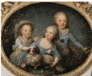
Anne Rosalie Filleul, née Boquet, Les Enfants du comte et de la comtesse d'Artois , 1781, huile sur toile ovale, Château de Versailles