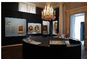
Vue de l'exposition « Le Comte d'Artois, prince et mécène » section « La jeunesse d'un prince » 2