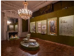
Vue de l'exposition « Le Comte d'Artois, prince et mécène » section « Un prince bâtisseur » 11