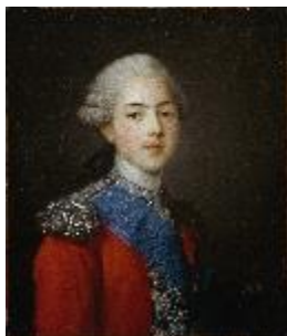
Jean Martial Frédou, Portrait du comte d'Artois en colonel général des Suisses et Grisons , 1773, huile sur toile, Château de Maisons