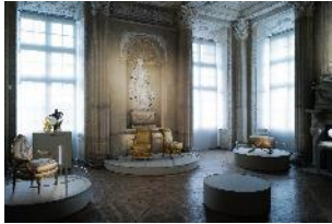
Vue de l'exposition « Le Comte d'Artois, prince et mécène » section « Le prince chez lui : Versailles et le palais du Temple » 18