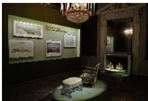
Vue de l'exposition « Le Comte d'Artois, prince et mécène » section « Un prince bâtisseur » 14