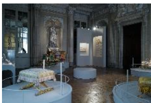
Vue de l'exposition « Le Comte d'Artois, prince et mécène » section « Le prince chez lui : Versailles et le palais du Temple » 16