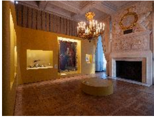
Vue de l'exposition « Le Comte d'Artois, prince et mécène » section « Un prince français » 5