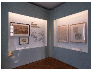
Vue de l'exposition « Le Comte d'Artois, prince et mécène » section « Un prince promoteur » 21