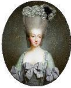
Joseph Ducreux, Marie-Thérèse de Savoie, comtesse d'Artois , 1775, huile sur toile ovale, Château de Versailles