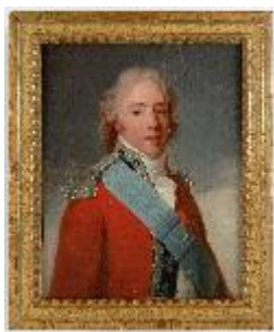
Henri Pierre Danloux, Le comte d'Artois en exil , 1798, huile sur papier marouflé sur toile, Château de Maisons