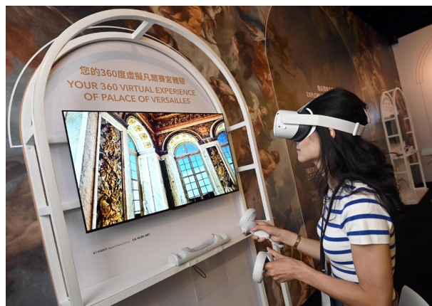
L'espace de réalité virtuelle «Versailles VR: le Château est à vous»

Au centre de la pièce, un pavillon est dédié à l'expérience de réalité virtuelle « Versailles VR: le Château est à vous » développée grâce au partenariat avec Google Arts and Culture. Munis de casques, les visiteurs flânent librement dans les Grands Appartements et la galerie des Glaces, expérimentent des contenus culturels inédits et peuvent manipuler de nombreuses peintures, sculptures et pièces de mobilier du château sous tous leurs angles.