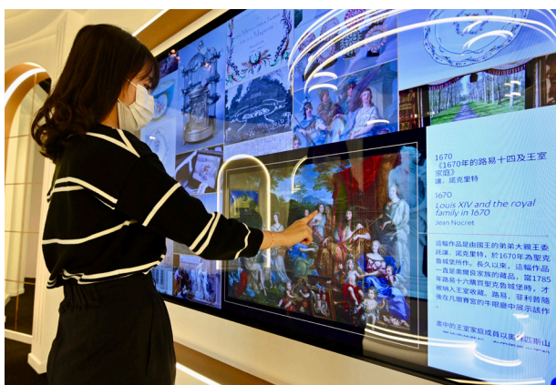
La galerie interactive de Virtually Versailles

Des reconstitutions 3D relatant la construction du château de Versailles, depuis le pavillon de chasse de Louis XIII au XVII e siècle, jusqu'à la signature du traité de Versailles en 1919, permettent d'appréhender la complexité du site et la diversité des lieux en quelques minutes.