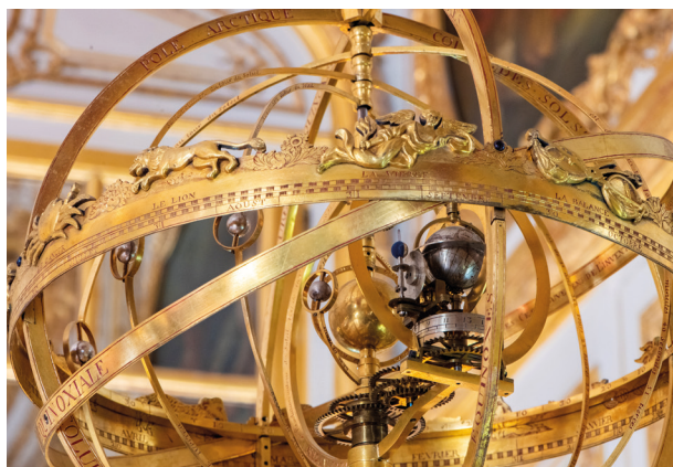
Système planétaire selon Copernic

À l'issue de cette restauration exceptionnelle, la pendule aura retrouvé tout son lustre et pourra de nouveau fonctionner comme au temps de Louis XV.