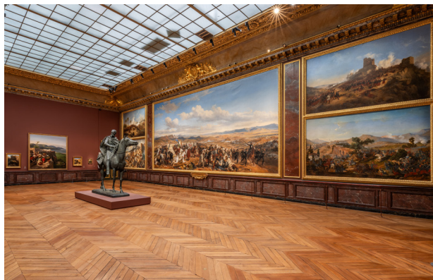
Vue de l'exposition Horace Vernet