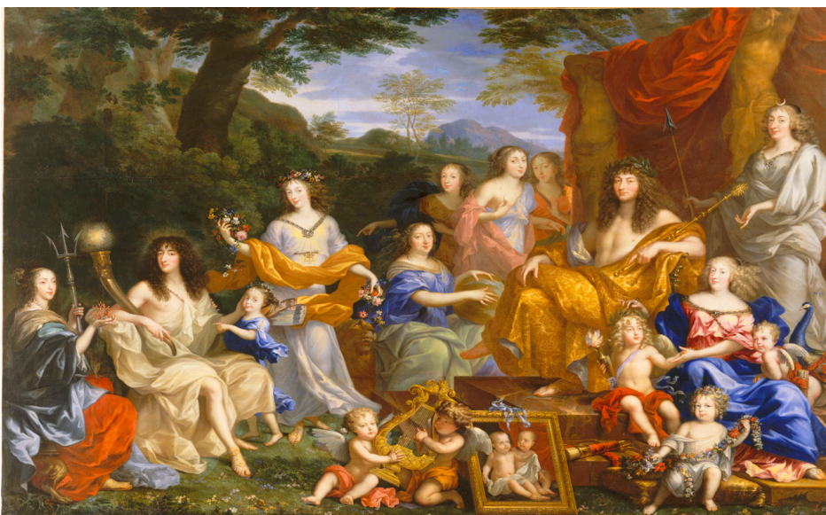
La Famille royale dans l'Olympe, Jean Nocret, vers 1670

personnages mythologiques, permettant ainsi au commanditaire de mêler plaisir du portrait et celui de la peinture d'histoire. Cette œuvre emblématique attire aujourd'hui les visiteurs : très photographiée, elle est aussi régulièrement reproduite.