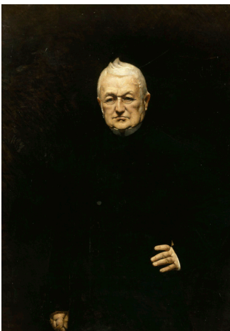
Adolphe Thiers, Léon Bonnat, 1878

Ce portrait, peint en 1878, est le premier des quatre tableaux à avoir rejoint les collections du château de Versailles. C'est aussi le premier d'une série que Léon Bonnat commença de sa propre initiative pour célébrer ses contemporains les plus illustres. Adolphe Thiers, avocat, journaliste, historien, diplomate et homme politique,