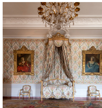
La chambre de Madame Adélaïde

Ouvert au public en visite libre, tous les jours, sauf le lundi.