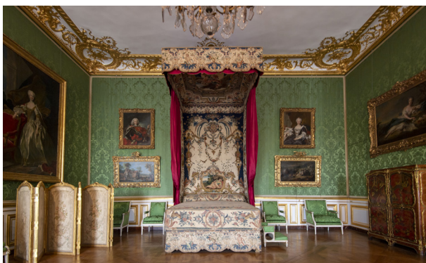
La chambre du Dauphin