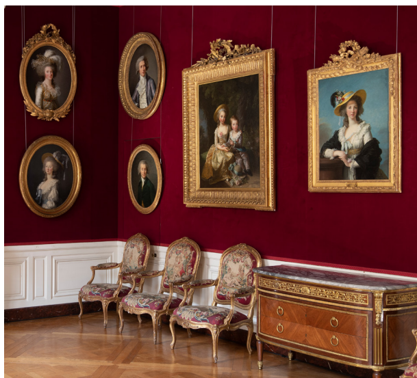
Appartement du Capitaine des Gardes

Cet appartement donnant sur la cour de Marbre, présente une exceptionnelle galerie de portraits, représentant la famille royale et son entourage, ainsi que plusieurs ministres d'État, sous le règne de Louis XVI et Marie-Antoinette. Le public pourra y découvrir certains des grands chefs-d'œuvre de la peinture du XVIII e siècle conservés dans les collections du château de Versailles, œuvres des plus grands artistes de l'époque à l'image d'Élisabeth Vigée Le Brun.