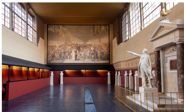
La salle du Jeu de Paume