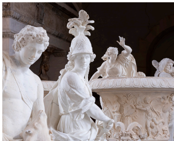
La galerie des sculptures et des moulages

Et du 14 mai au 13 juillet : tous les jours, sauf le lundi, de 12h30 à 18h30.