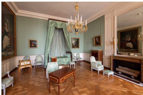
Chambre de Marie-Antoinette

Pour se dégager quelque peu des contraintes de l'étiquette versaillaise, Marie-Antoinette recherche une vie plus intime qu'elle trouve dans ses appartements privés (cabinets intérieurs dans les étages et petit appartement au rez-de chaussée). Le public est convié à découvrir deux des pièces les plus privées à l'usage de la souveraine : sa chambre et sa salle de bain.