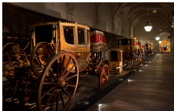
La galerie des Carrosses

Ouvert au public en visite libre, tous les samedis et dimanches de 12h30 à 18h30.