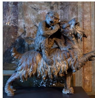
Sculpture en plomb du bosquet Labyrinthe

Alternant entre des pièces de réception et des salons plus privés, ces appartements princiers sont un témoin précieux et évocateur du cadre de vie de la famille royale à Versailles à la fin de l'Ancien Régime.