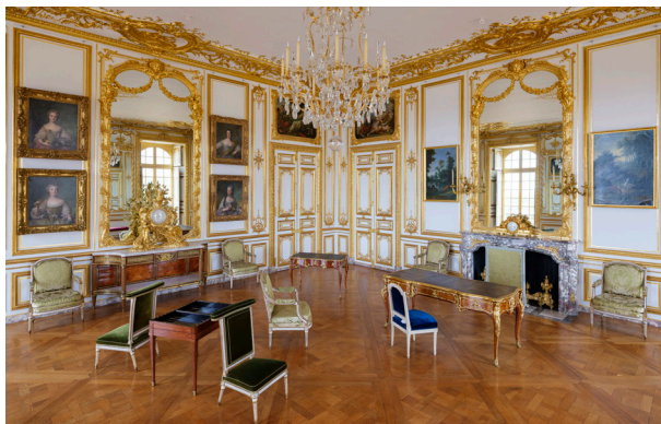
Le grand cabinet du Dauphin

Ouvert au public en visite libre, tous les jours, sauf le lundi.