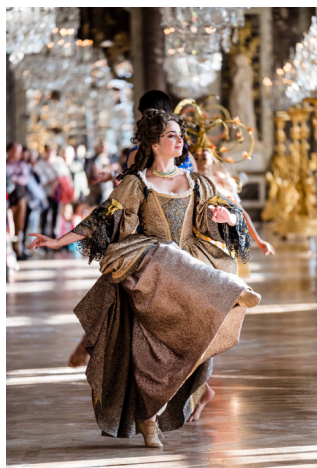
Le Parcours du Roi

À la tombée de la nuit, guidés par des comédiens, des musiciens, des danseurs baroques, des escrimeurs et des magiciens, les visiteurs pourront découvrir ou redécouvrir les plus belles salles du Château au cours de la visite-spectacle Le Parcours du Roi . Les groupes iront des Grands Appartements à la