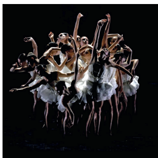
Le Lac des cygnes - A. Preljocaj

galerie des Glaces illuminée de feux d'artifices, jusqu'à la galerie des Batailles, où ils pourront rencontrer le Père Noël.