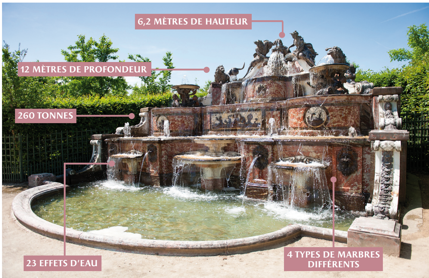
Le Buffet d'eau avant restauration

Le Buffet d'eau se compose d'un bassin surplombé de trois gradins de marbre aux couleurs variées allant du rouge du Languedoc et Campan royal au blanc de Carrare.