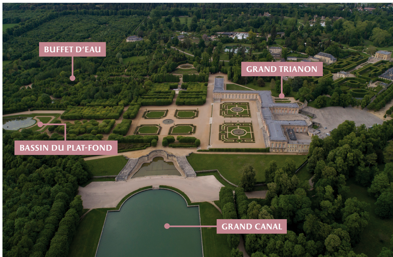
Le Grand Trianon et ses jardins