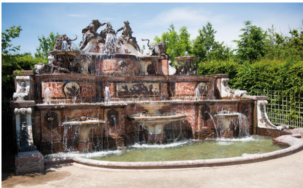
Le Buffet d'eau avant restauration

En janvier 2022, le château de Versailles a lancé, grâce au mécénat de la Fondation Bru, un ambitieux chantier de restauration au sein des jardins du Grand Trianon : le Buffet d'eau. Cette fontaine méconnue mais spectaculaire grâce à ses multiples effets d'eau va retrouver tout son lustre. Les travaux, d'une durée de dix-huit mois, vont mobiliser de nombreux savoirs-faire et vont permettre d'achever la remise en eau des jardins du Grand Trianon.