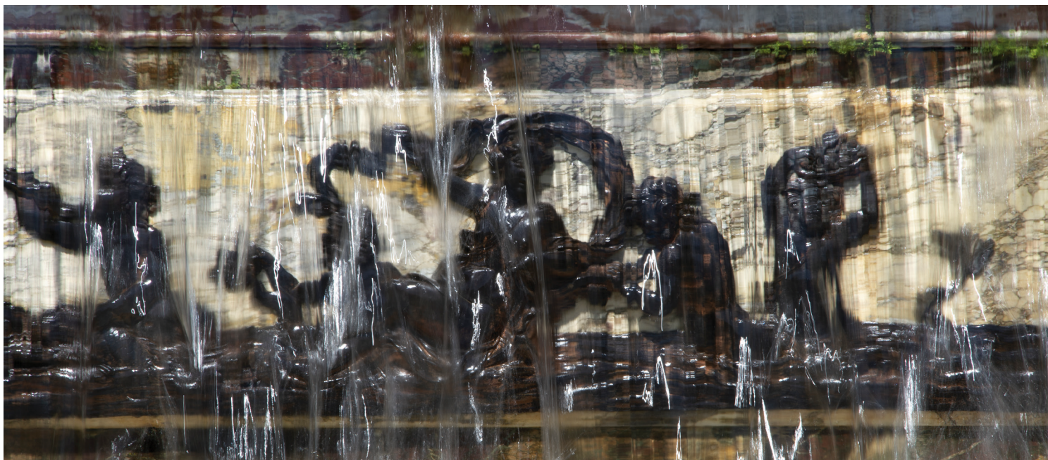
Détail du Buffet d'eau avant restauration

Au sommet de la composition se trouvent Neptune et Amphitrite , encadrés de deux lions, et quatre jeunes tritons s'ébattant sous des vasques. Aux niveaux inférieurs sont placés des bas-reliefs de divinités marines et de guirlandes.