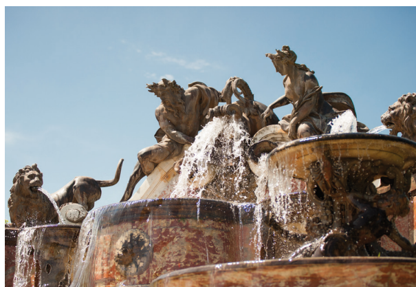
Détails du Buffet d'eau avant restauration