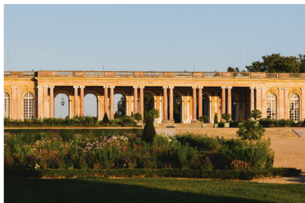
Le Grand Trianon et ses jardins