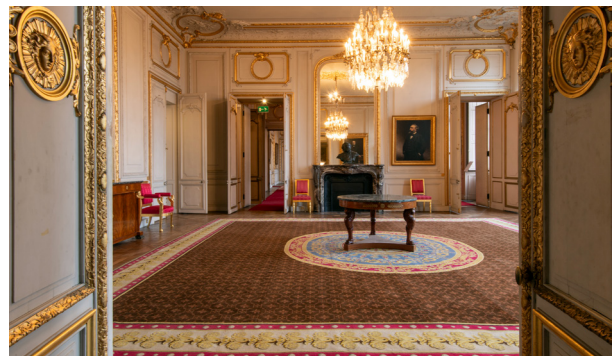
L'appartement du président du Congrès

Construit en même temps que la salle du Congrès, il présente un décor néo-Louis XV et remplace d'anciens appartements de membres de la famille royale. C'est dans ces murs qu'avait lieu l'investiture des présidents de la République (1871-1954). Des œuvres des XIX e et XX e siècles issues principalement des collections du Château y ont été accrochées et offrent aux visiteurs un aperçu de la vie parlementaire sous la III e République.