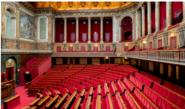
La salle du Congrès

Bâtie en 1875 en seulement six mois, elle est plus grande que les hémicycles de l'Assemblée nationale et du Sénat. Son majestueux décor s'inspire du grand appartement de Louis XIV et ne manque pas de références au Roi-Soleil. Seize présidents de la République y ont été élus et c'est sur ses bancs que se réunissent aujourd'hui en Congrès les députés et sénateurs à l'occasion des modifications de la Constitution ou lors des allocutions du président de la République.