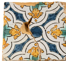
Carreau de faïence ayant orné des bassins de Marly.

Exposition ouverte jusqu'au 12 octobre 2025.