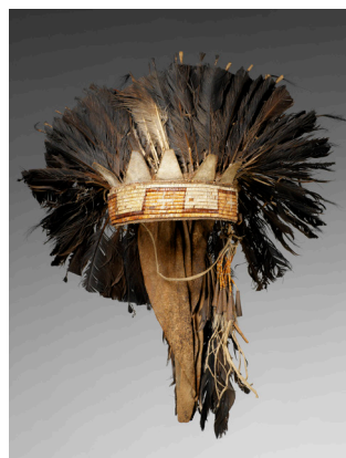
Coiffe, fond en peau, bandeau frontal de piquants de porc-épic tressés, Amérique, région des Plaines

L'un des moments les plus emblématiques et spectaculaires de cette alliance est la venue en France de chefs oto, osage, missouri et illinois, à l'automne 1725, à