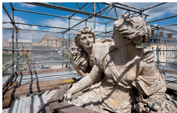
Vertumne et Pomone avant restauration

En parallèle, les sculptures monumentales, réalisées par Louis Le Conte et Pierre Legros vers 1687, devaient également être restaurées. Inspirées des Métamorphoses d'Ovide, elles célèbrent les amours des dieux à travers quatre couples mythologiques : Aurore et Céphale ; Vertumne et Pomone ; Flore et Zéphyr et Vénus et Adonis . Chacune d'entre elles pesant environ 20 tonnes, il était nécessaire de trouver un atelier capable d'accueillir ces monuments de pierre.