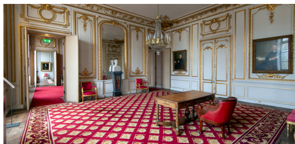
L'appartement du président du Congrès