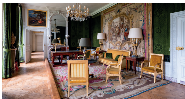
Le bureau du général de Gaulle

La salle du Congrès et l'appartement du président du Congrès sont ouverts à la visite libre tous les weekends et en visite guidée pendant la semaine jusqu'en septembre.