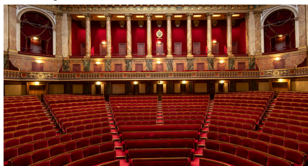
La salle du Congrès