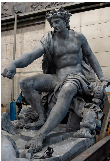
Apollon avant son entrée dans l'atelier de restauration de la Fonderie de Coubertin spécialement aménagé pour le traitement du plomb en sécurité

La sculpture d' Apollon est entrée en atelier plomb au début du mois de décembre après que les restaurateurs aient consolidé ses armatures. Elle est l'ultime élément du groupe à être restauré et aussi le plus monumental : 2,7 mètres de haut et 6,5 tonnes . Une fois l'enveloppe restaurée, Apollon poursuivra, à partir de mi-janvier, sa métamorphose par sa mise en dorure. Comme pour l'ensemble du groupe, les restaurateurs appliqueront les différentes couches d'apprêt et de mixtion avant de dorer la sculpture à la feuille d'or selon l'option prise par le ministère de la Culture. Ils patineront ensuite la sculpture dans des tons chauds afin de retrouver l'effet de la bronzure d'origine.