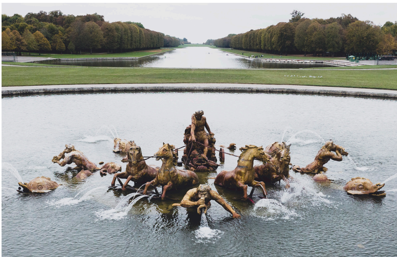
Le bassin du char d'Apollon avant restauration

Situé au centre de la Grande Perspective entre le Château et l'Étoile royale, le bassin du char d'Apollon représente le lever du soleil. Exécuté par Jean-Baptiste Tuby entre 1668 et 1670 sous le règne de Louis XIV, cette sculpture en plomb pèse environ trente tonnes et comprend treize statues. Au centre, Apollon est accompagné d'un Amour sur son char, attelé de quatre chevaux. Les quatre points cardinaux de l'ensemble sont occupés par des tritons, tandis que les pans coupés portent des dauphins.