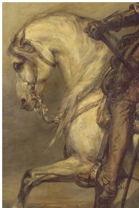
Portrait équestre d'Henri IV, roi de France, Ary Scheffer (1795-1858), 1828, château de Versailles