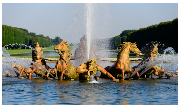
Le bassin du char d'Apollon avant restauration

Le bassin du Char d'Apollon sera remis en eau en avril 2024 pour les Grandes eaux, à l'issue d'une restauration exceptionnelle ayant nécessité l'intervention de nombreux savoir-faire : fonderie d'art, métallurgie, dorure, fontainerie, maçonnerie - pierre de taille.