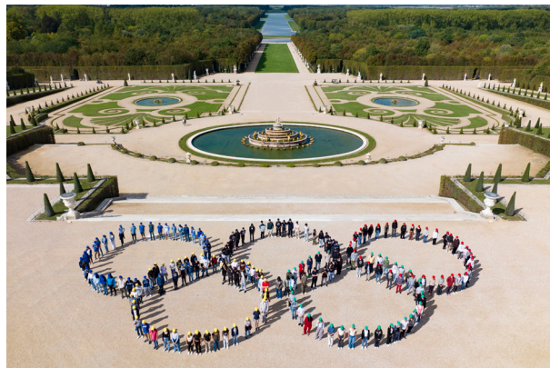
400 jeunes célèbrent les anneaux olympiques au château de Versailles