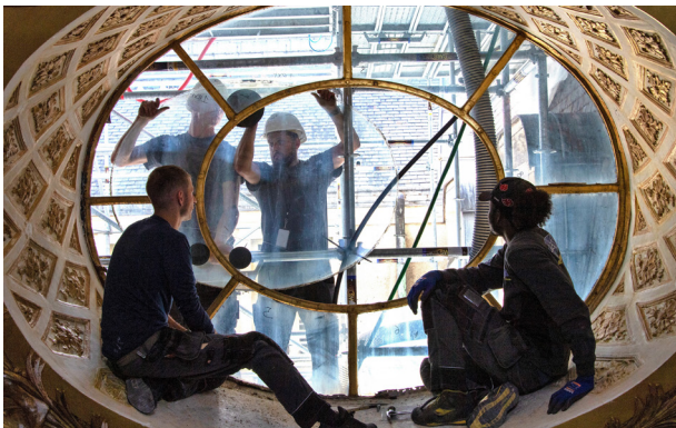
Dépose de l'Œil-de-Bœuf

Pièce emblématique de la vie à la cour sous le règne de Louis XIV, l'antichambre de l'Œil-de-Bœuf fait l'objet d'une restauration d'envergure. Cette opération permettra de retrouver les boiseries, les dorures et le décor peint de ce chef-d'œuvre des arts décoratifs. Le Château réalise également la mise en conformité de l'appartement du Roi où est située la célèbre chambre du Roi. L'ensemble rouvrira au public à l'été 2024.