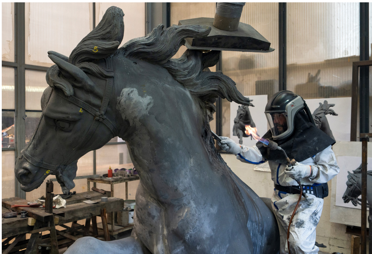
L'une des sculptures en plomb du char d'Apollon en cours de restauration à la Fonderie de Coubertin