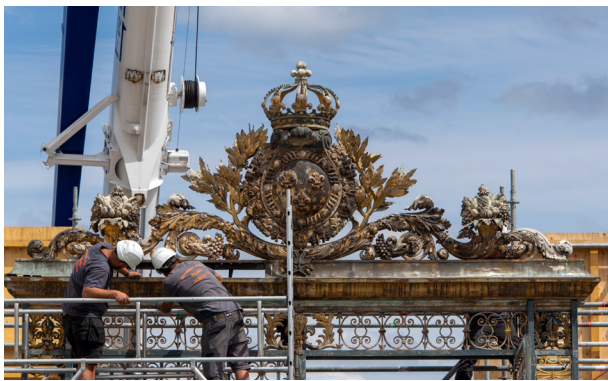
Dépose de la grille d'honneur

Le château de Versailles restaure actuellement la grille d'honneur, entrée principale du Domaine, et les deux groupes sculptés de Girardon et Marsy qui l'encadrent. L'opération, réalisée grâce au financement du Département des Yvelines, permettra de remettre en état la grille selon les dispositions et ornements existantes depuis le XIX e siècle. L'habillage de chantier, installé en septembre 2023, sera en place jusqu'au printemps 2024, date à laquelle la grille d'honneur restaurée sera dévoilée au public.