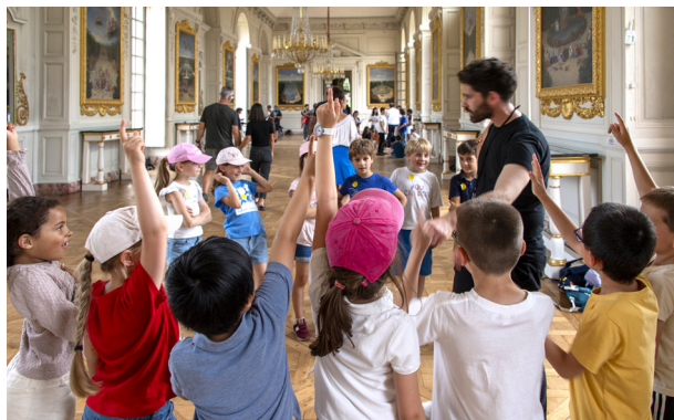
Un atelier du Pentathlon des arts au Grand Trianon

En 2023-2024, le château de Versailles proposera aux publics scolaires et éloignés de la culture des ateliers Pentathlon des arts . Mené en partenariat avec l'Académie de Versailles, le dispositif À l'école du patrimoine et de la création : des corps et des muses , auquel participent près de 2000 élèves, s'appuiera également sur cette programmation.