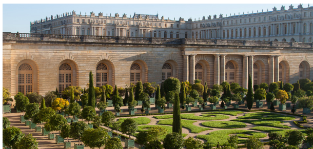
L'Orangerie et son parterre

À l'occasion de la 22 ème édition des Rendez-vous aux jardins , le château de Versailles propose de mettre en lumière l'Orangerie royale, joyau des jardins imaginés par Louis XIV, qui préserve, aujourd'hui encore, une collection historique inestimable d'arbres en caisses. Sur le parterre, le public pourra découvrir cette collection d'orangers, de citronniers ou encore de grenadiers, ainsi que son patrimoine sculpté. Dans la grande nef minérale de l'Orangerie, un cinéma éphémère projettera des films tournés dans les jardins de Versailles.