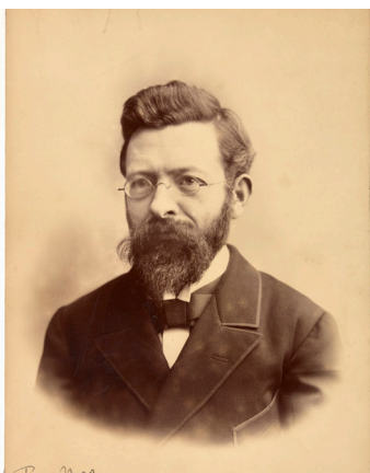
Pierre de Nolhac

Conservateur du château de Versailles, Pierre de Nolhac (1859-1936) a joué un rôle fondamental dans l'histoire du musée. Lorsque le jeune attaché de conservation y est nommé auprès de Charles Gosselin en 1886, il découvre un château en déclin, marqué par l'abdication de Louis-Philippe en 1848 et par la défaite de la guerre de 1870. Les visiteurs se font rares, et le palais, encore trop associé à la monarchie, peine à trouver sa place dans une République naissante.