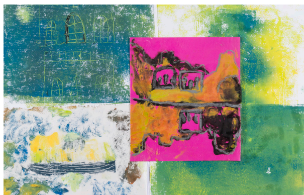
Escale à Versailles 2017, avec l'Institut Médico-Éducatif Bel Air au Chesnay