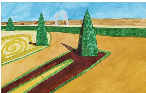
Escale à Versailles 2015, avec l'association Zig Zag Color

Informations et renseignements : chateauversailles.fr