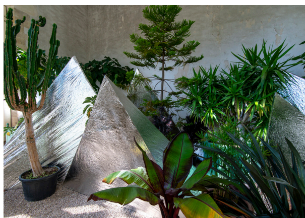
Escale à Versailles 2021 : avec l'association Arts Convergences