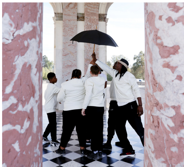
Restitution au Grand Trianon

Après une découverte des lieux, et plusieurs ateliers de création, chaque groupe revient à Versailles pour y danser sa chorégraphie. Ces chorégraphies sont captées par un vidéaste et un photographe, dont les photographies seront exposées à la fin de l'année.