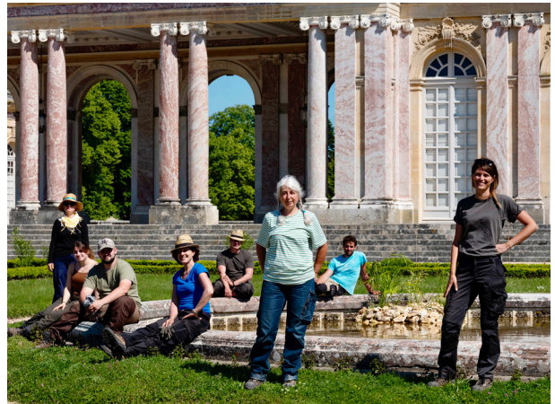
Les jardiniers du Grand Trianon

Ce parterre est le fruit d'un travail de plusieurs mois menés par les jardiniers de Trianon grâce aux conseils scientifiques ainsi qu'aux dons et aux prêts de grandes institutions comme l'Arboretum de Versailles-Chèvreloup (MNHN), le Domaine national de Saint-Cloud, le Parc de Bagatelle - Jardin botanique de Paris, le Jardin du Luxembourg, le Centre Horticole de la Mairie de Paris ou encore le Musée du quai Branly - Jacques Chirac.