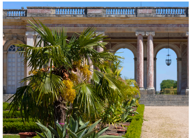
Vue du parterre africain du Grand Trianon

Toutes les essences africaines ne fleurissant pas en été à Versailles, ce parterre mêle des essences africaines mais également des plantes et des fleurs originaires d'Océanie, de Chine et d'Asie tropicale qui révèlent avec la même