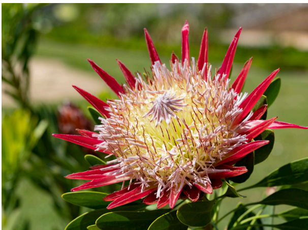
Protea rouge d'Afrique du Sud