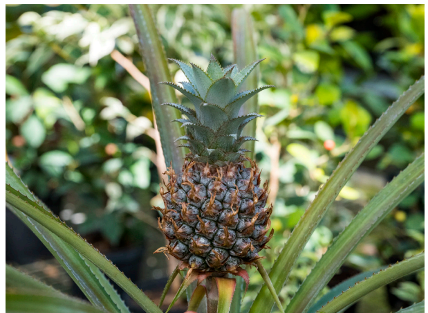
Ananas du Grand Trianon