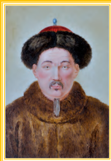
Portraits de Louis XV (à gauche) et de l'empereur de Chine, Qianlong (à droite).