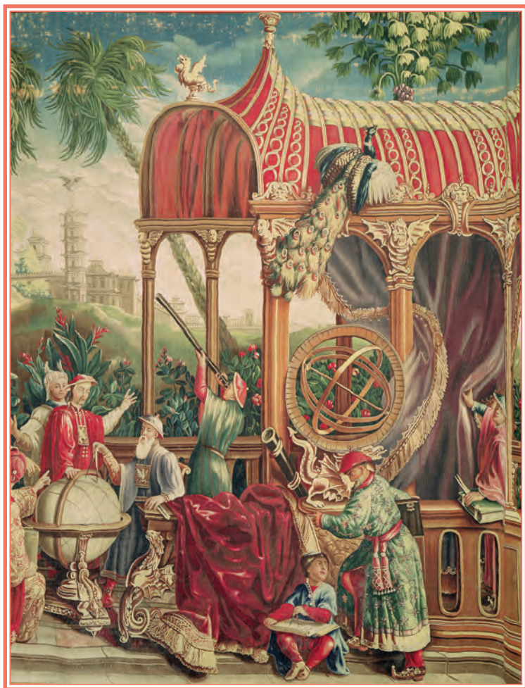
Tapiserie Les Astronomes . Pièce de la première tenture chinoise de Beauvais.