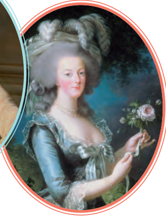
Portraits de Louis XVI et de Marie-Antoinette.

L'intérêt pour la Chine se poursuit sous Louis XVI qui garde le ministre Bertin à son service. Le goût du roi pour l'art chinois est surtout visible dans ses appartements privés. Officiellement, le roi doit soutenir les artisans français. Marie-Antoinette, elle aussi, collectionne des objets d'Extrême-Orient dans le Cabinet doré de Versailles, dont certains proviennent de sa mère, Marie-Thérèse d'Autriche.