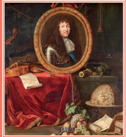
Portrait de Louis XIV, parmi les attributs des arts et des sciences.

Sur le tableau à droite, Louis XIV est présenté en protecteur des arts et des sciences. Un globe terrestre et des objets de mesure montrent son intérêt pour les grandes découvertes. C'est par le biais des sciences que le roi est entré en contact avec l'empereur Kangxi. Observe les éléments communs entre les deux images.