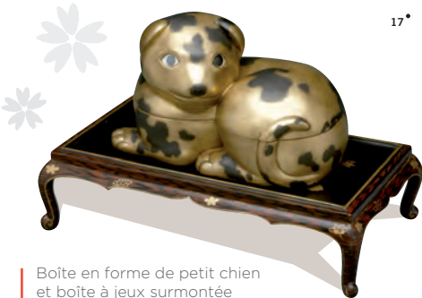
Boîte en forme de petit chien et boîte à jeux surmontée d'un personnage couché.