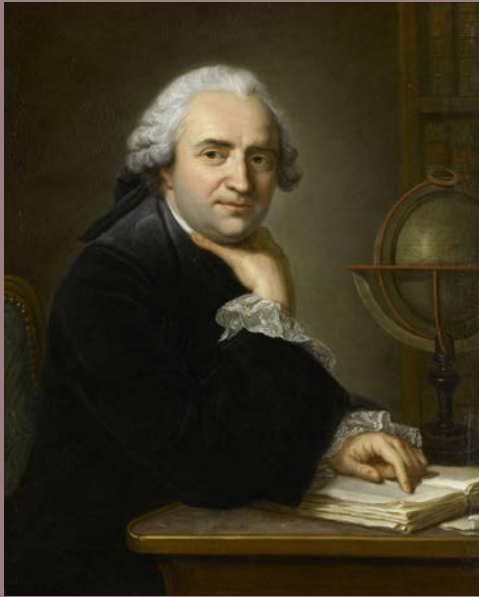
Anonyme, Jean-Baptiste Bourguignon d'Anville, géographe, XVIII e siècle Huile sur toile, H. : 81,3 ; L. : 64,8 cm