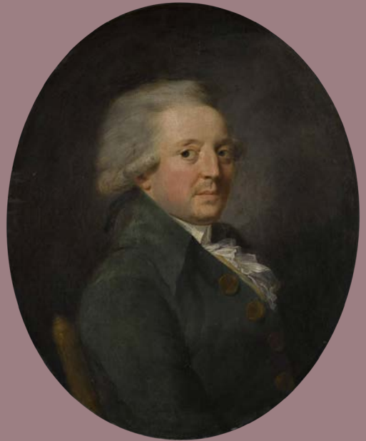
Anonyme, Nicolas de Condorcet, 1779-1793 Huile sur toile, H. : 72,5 ; L. : 59,2 cm