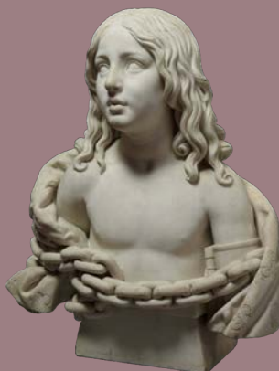
Achille-Joseph-Etienne Valois Louis XVII enchainé , 1827 Marbre, H. : 78 ; L. : 75 ; P. : 72 cm

Le nouveau projet ambitionne de réunir les chefs-d'œuvre de la seconde moitié du XVIII e siècle. Cette période charnière, marquée par le règne tourmenté de Louis XVI et Marie-Antoinette, l'effervescence intellectuelle des Lumières et le bouleversement de la Révolution française, sera mis en récit à travers plus de cent cinquante peintures et sculptures, dont 20 font l'objet d'une restauration.