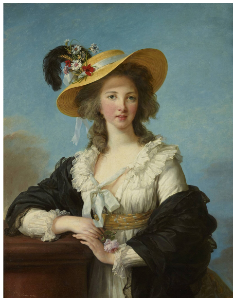
Yolande-Martine-Gabrielle de Polastron, duchesse de Polignac, Elisabeth Vigée-Le Brun, 1782, huile sur toile