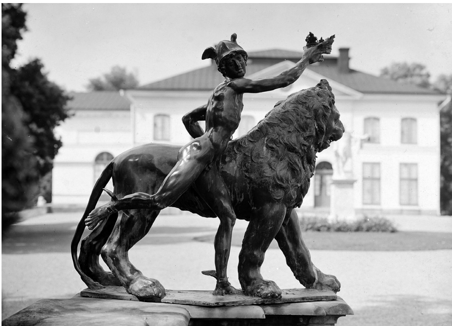
Adriaen De Vries, Mercury couronnant un lion (détail), XVI e - XVII e siècle © Nationalmuseum

Christophe Leribault, président du château de Versailles