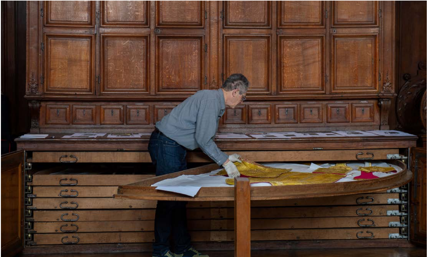
Installation des vêtements liturgiques dans les chapiers de la grande sacristie