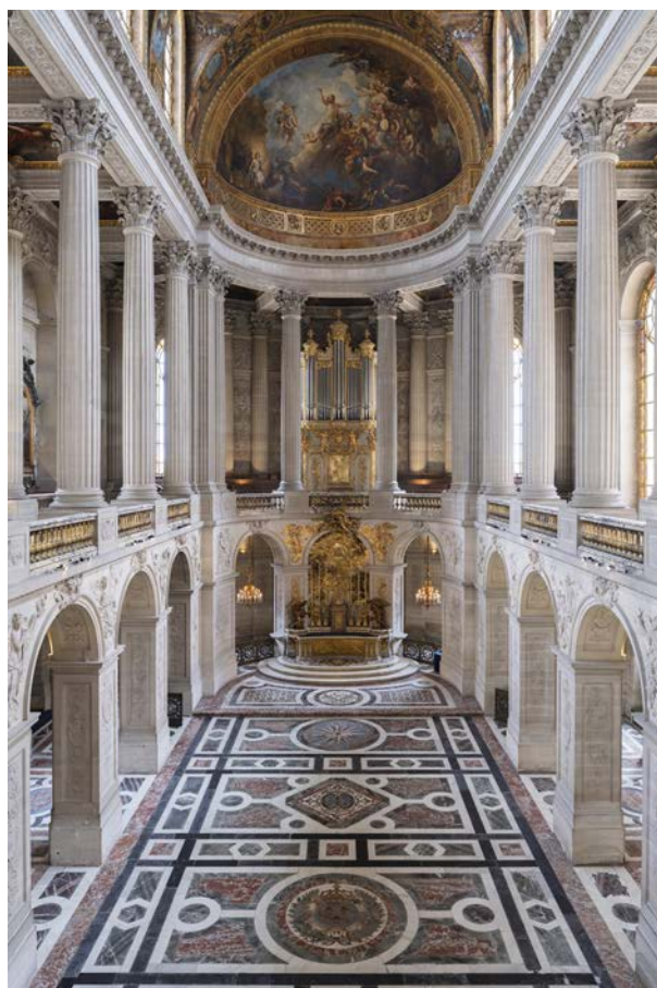
La Chapelle royale de Versailles

Ce lieu central du Château avait une place fondamentale dans le quotidien de la cour de Versailles. En effet, le roi de France se rendait tous les jours à la messe et les cérémonies religieuses étaient nombreuses tout au long de l'année.