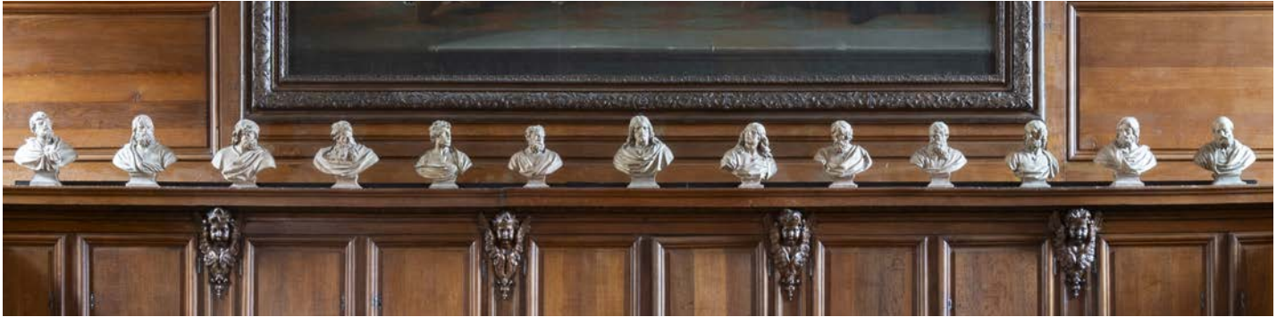
La grande sacristie, détail : Le Christ et les apôtres, exécutés au XVIIe siècle par Jacques Sarazin