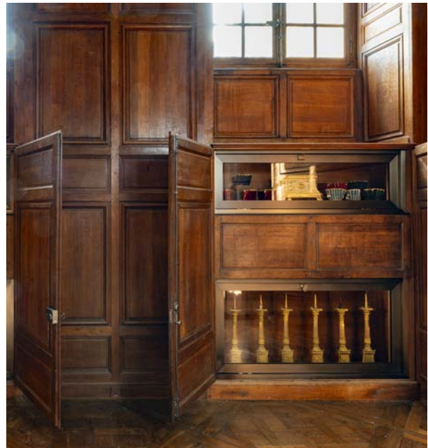
Pièce du lavabo, présentations dans les vitrines

Dans le cadre de la restauration de la pièce, il a été décidé de la doter de plusieurs vitrines, dissimulées dans les placards d'origine, afin de permettre une présentation d'objets nécessaires au culte, issus des collections du château de Versailles et jusque-là jamais montrés au public.