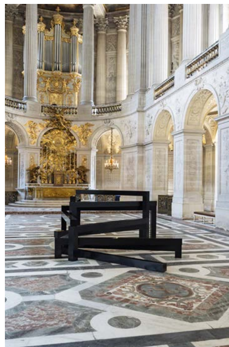
Beaming \pi A.N.I=10° de François Morellet

Cinq autres œuvres de l'artiste sont également visibles dans le chateau et le bosquet des Bains d'Apollon, jusqu'au 1 er novembre 2026.