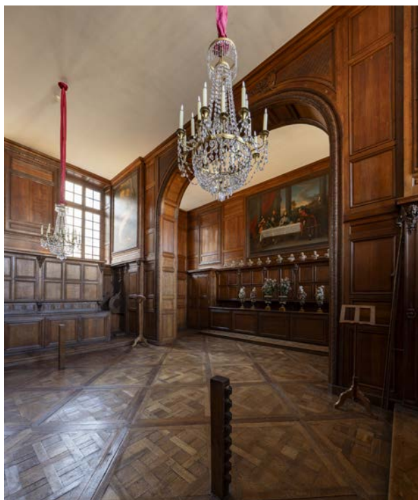
La grande sacristie