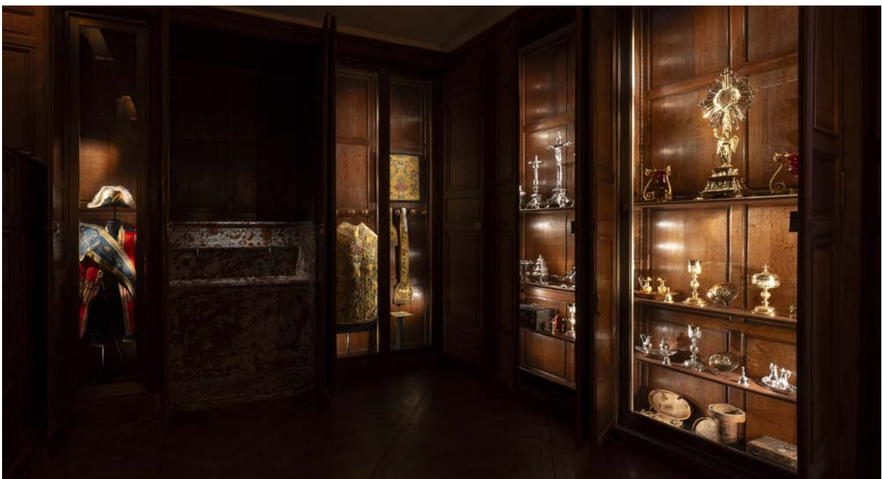
Pièce du lavabo, présentations dans les vitrines

Le budget de cette opération constitue le mécénat financier le plus important jamais porté par la Société des Amis de Versailles pour une restauration architecturale.