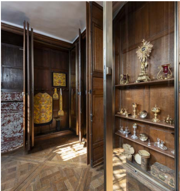
Pièce du lavabo, présentations dans les vitrines

Elle renferme également un ouvrage exceptionnel qui lui donne son nom : un lavabo plaqué de marbre rouge du Languedoc dans lequel deux robinets distincts permettaient de séparer les eaux pures, utilisées dans les rituels liés à la liturgie, de celles souillées par les manipulations.