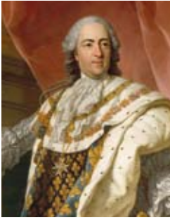
Louis XV (1710-1774), roi de France et de Navarre, en grand manteau royal en 1760, par Jean Martial Fredou (1710-1795), d'après Van Loo (1707-1771), 1763, Versailles, château de Versailles