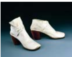
Paire de chaussures d'homme, fin du XVII e – début du XVIII e siècle

CES LUXUEUSES CHAUSSURES D'HOMME sont des témoignages extraordinaires de la mode de chaussures blanches à talon rouges portées à la cour de Louis XIV. Ce type de chaussures, décorées de grands noeuds, de broches et de boucles, était destiné à être porté à la cour par un souverain ou un courtisan. Elles étaient considérées comme le signe d'une élégance particulière. Hyacinthe Rigaud les met particulièrement en valeur dans son grand portrait de Louis XIV en costume royal daté de 1701. Les fameux talons rouges apparaissent à la cour de France vers 1670. Ils furent portés jusqu'à la fin du XVIII e siècle par les souverains d'Europe.