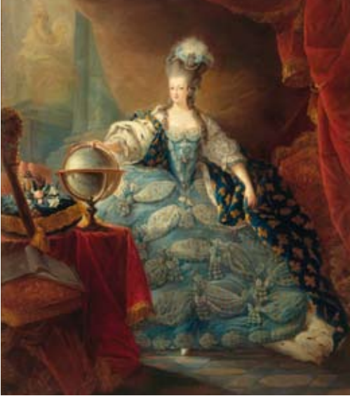
Marie-Antoinette en grand habit de cour, par Jean-Baptiste André Gautier-Dagoty (1740-1786), 1775 Versailles, château de Versailles

MARIE-ANTOINETTE EST VUE EN PIED , la main droite appuyée sur une mappemonde. Son grand habit de cour se compose d'un grand corps baleiné largement décolleté en ovale, se terminant en pointe, d'une jupe de soie sur très grands paniers, ornée de bouillonnés de gaze rayée et ponctuée de glands de passementerie. Elle porte enfin un manteau de cour fleurdelisé doublé d'hermine. Sur les cheveux bien relevés est posé un pouf de velours, surmonté d'un bouquet de grandes plumes blanches fixé par une aigrette de diamants.