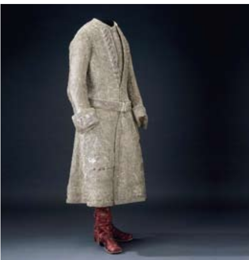
Habit de couronnement de Gustave III, 29 mai 1772

Habit de couronnement de roi Gustave III de Suède (1746-1792), le 29 mai 1772