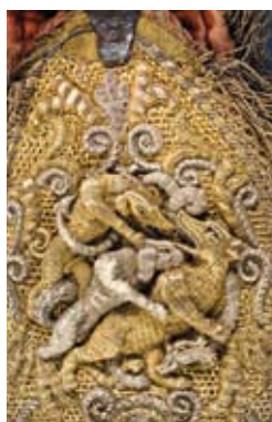
Baudrier avec motif d'animal (détail), milieu du XVII e siècle

LE CENTRE DE RECHERCHE DU CHÂTEAU DE VERSAILLES organise un colloque international, dans le cadre du programme de recherche « Se vêtir à la Cour : typologie, usages et économie », sur les cultures matérielles et visuelles du costume dans les cours européennes (1300-1815).