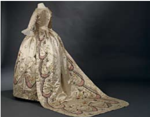
Robe parée : robe et jupe, 1780-1790

LES ROBES DITES « PARÉES » étaient très à la mode dans les années 1780-1785 et se prêtaient à merveille aux talents des marchandes de modes.