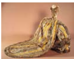
Grand habit de poupée: grand corps, jupe, queue de jupe, vers 1769-1775

le grand corps de robe, baleiné, très rigide avec un large décolleté et un départ de manches, la jupe, sur un large panier, et enfin le bas de robe ou queue, c'est-à-dire la traîne. Madame de Genlis, gouverneur des enfants du duc d'Orléans indique dans ses Mémoires qu'« Il fallait 20 ou 22 aunes d'étoffe pour faire un grand habit » soit vingt-quatre à vingt-six mètres. Aujourd'hui, il faut 10 fois moins de tissu pour faire une robe. Ce grand habit, qui ne servait qu'une seule fois, coûtait très cher : jusqu'à 3 000 livres. À titre de comparaison, une famille entière d'ouvriers tisseurs (4 personnes) disposait de 340 livres de budget annuel, vivant à Abbeville vers 1765.