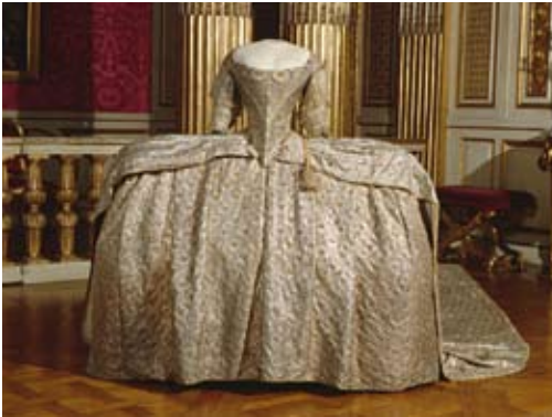
Robe de cour (grand habit) portée pour le couronnement de Sophie Madeleine, le 29 mai 1772

BIEN QUE SUÉDOISE , la robe de couronnement en drap d'argent façonné de la princesse Sophie Madeleine est un grand habit comme ceux que les reines de France portent à la cour. Il est constitué des trois pièces essentielles, amovibles : le grand corps ou corps de robe, la jupe sur un immense panier – ici de près de deux mètres, et le bas de robe ou queue, c'est-à-dire une traîne, longue de cinq mètres et attachée à la taille par des agrafes d'argent.