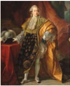
Le Comte d'Artois en grand habit de l'ordre du Saint-Esprit, Antoine-François Callet (1741-1823), quatrième quart du XVIII e siècle

LE ROI EST ICI REPRÉSENTÉ DEBOUT , la main droite appuyée sur la couronne et tenant le sceptre de Charles V surmonté de la statuette de Charlemagne. Ce sceptre, que l'on peut voir aujourd'hui au Louvre, a perdu sa fleur de lis émaillée qui servait de base à la statuette. Louis XV est vêtu de l'ample manteau royal en velours semé de fleur de lis d'or et doublé d'hermine. Il est décoré du collier de l'ordre du Saint-Esprit et de celui de la Toison d'or, et porte la culotte bouffante propre à cet ordre. On distingue à peine l'épée, mais la main de justice est bien visible à côté de la couronne.