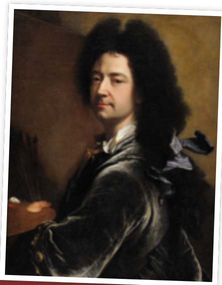
Autoportrait d'Hyacinthe Rigaud (1659-1743), 1716-1727. Huile sur toile. Perpignan, musée d'Art.

À l'époque, le tube de peinture n'existe pas encore. Les peintres font leurs propres couleurs à base de pierres, de terre, de charbon de bois, de plantes et, parfois même, d'insectes. Et, souvent, ce sont des apprentis (des enfants dès 12 ans !) qui les aident dans la préparation. À chacun sa recette !