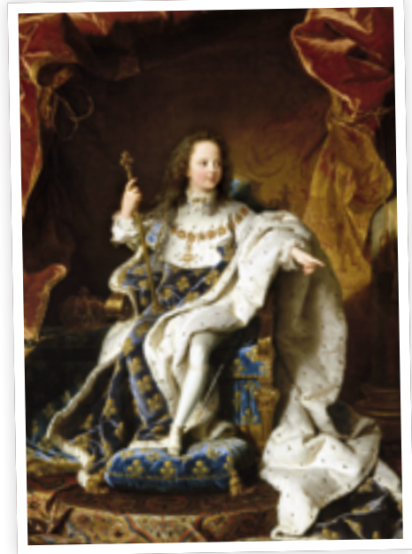
Portrait de Louis XV Hyacinthe Rigaud (1669-1743). 1715-1717. Huile sur toile. Musée national des Châteaux de Versailles et de Trianon.

Voici la représentation d'un autre enfant : il s'agit du jeune roi Louis XV, âgé de seulement 5 ans ! Il est représenté en costume d'apparat avec tous les attributs royaux, comme son arrière-grand-père Louis XIV, à qui il vient tout juste de succéder. Tu auras remarqué que Louis XV est sagement assis sur le trône... Et toi, comment te ferais-tu représenter si tu étais le roi ?