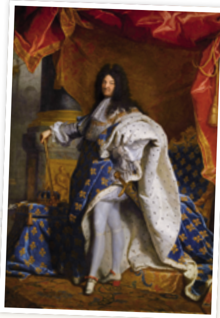
Portrait de Louis XIV en costume Hyacinthe Rigaud (1669-1743). 1701-1702. Huile sur toile. Musée du Louvre, Paris.

Les fleurs de lys représentées sur le manteau de Louis XIV sont un symbole royal depuis les premiers rois capétiens, au X e siècle. Quant à la main de justice, avec ses trois doigts ouverts, elle représente depuis le Moyen Âge l'autorité judiciaire du roi.