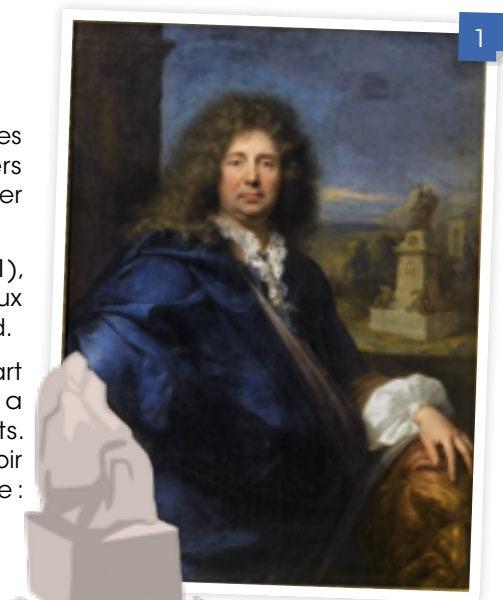
1. Portrait de Marin Van den Bogaert, dit Desjardins (1640-1694), sculpteur. Hyacinthe Rigaud (1691-1743), 1683. Huile sur toile. (Musée des châteaux de Versailles et de Trianon.)