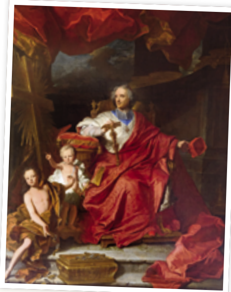
Portrait of Emmanuel Théodose de la Tour d'Auvergne, cardinal de Bouillon, Hyacinthe Rigaud (1699-1743). Huile sur toile. Musée d'art Hyacinthe Rigaud, Perpignan.