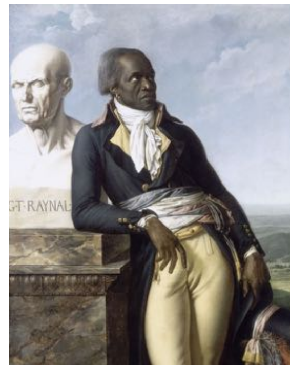
Jean-Baptiste Belley, député de Saint-Domingue. Anne-Louis Girodet de Roucy-Trioson. 1797.

Voir l'œuvre sur le site des collections du château de Versailles