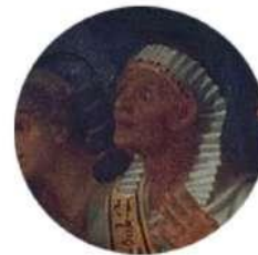
Charles Le Brun