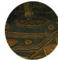
Carle Van Loo