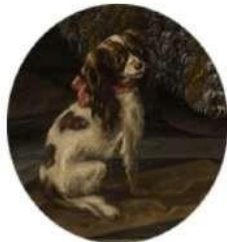
Carle Van Loo

Nous voici dans le salon de Mars (découvrez le dieu sur son char tiré par des loups, en levant les yeux au plafond). Pour chacun des fragments d'œuvres suivants, retrouvez les œuvres correspondantes.