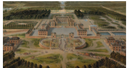
Vue perspective du château et des jardins de Versailles, 1668, Pierre Patel, Versailles