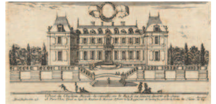
Le château de Versailles de Louis XIII, Israël Silvestre, gravure

ENTRE 1678 ET 1689, l'aile du midi et l'aile du nord sont construites ; la façade s'étend désormais sur 670 mètres. L'orangerie actuelle est également érigée durant cette période.