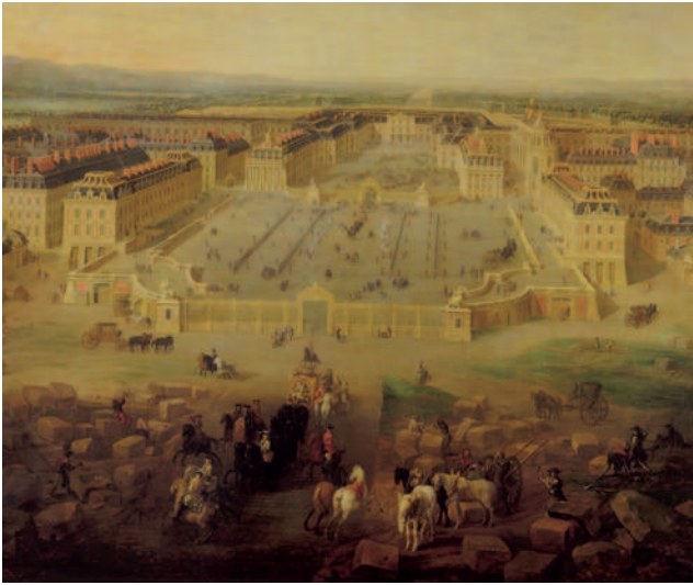
Vue du château de Versailles, de la place d'Armes en 1722 Pierre-Denis Martin, Versailles

C'EST EN 1682 QUE LOUIS XIV décide d'éloigner le gouvernement et la cour de Paris pour les installer définitivement à Versailles suite aux événements de la Fronde* auxquels il a été confronté durant sa jeunesse. Depuis le Moyen-Âge, la cour est traditionnellement « nomade », se déplaçant de château en château pour permettre au roi de se faire connaître et pour faciliter les nécessités de service et d'entretien. Jusqu'à cette décision de Louis XIV, le véritable palais royal est au Louvre, en plein cœur de Paris. La chapelle royale est consacrée* en 1710 ; ce sera la dernière réalisation du vivant de Louis XIV.