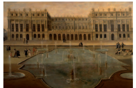
Vue du château de Versailles sur le parterre d'eau, vers 1675, école française, Versailles