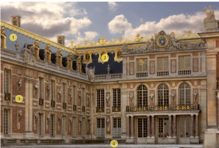
FAÇADE CÔTÉ COUR (ANCIEN CHÂTEAU DE LOUIS XIII)