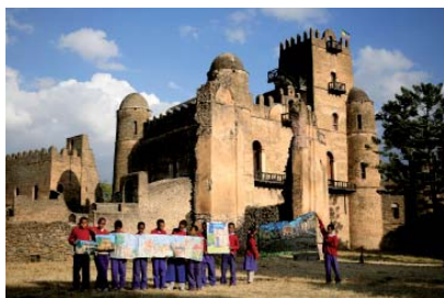
Les élèves de la classe de CM2 de l'école Debre Salam Saint Mary de Gondar posent fièrement avec leurs dessins devant le chateau de Fasilidas.

AVEC « DESSINE-MOI UN CHÂTEAU » , la sensibilisation au patrimoine historique s'accompagne d'une initiation artistique visant à encourager la créativité des élèves et à stimuler leur sensibilité. Les enfants sont entraînés dans une démarche de création artistique s'appuyant sur des sorties. Ils ont ainsi visité le chateau de Versailles, le musée départemental Maurice Denis et le Musée-Promenade de Marly-le-Roi/Louveciennes. Au cours d'ateliers ponctuant l'année scolaire, les élèves ont exprimé pleinement leur créativité à travers la pratique du dessin (pastel, fusain, etc.).