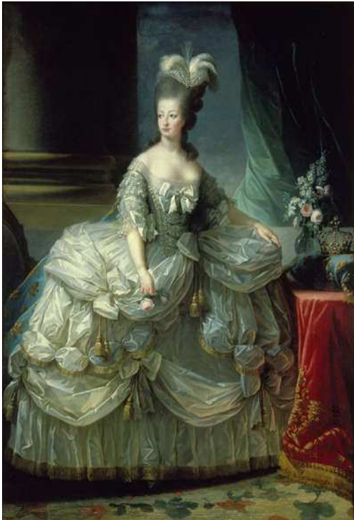
Marie-Antoinette, par Elisabeth Vigée-Lebrun (1755-1842)

Marie-Antoinette (1755-1793) : Fille de François de Lorraine et de l'impératrice Marie-Thérèse. Son mariage avec le futur Louis XVI, le 16 mai 1770 , couronne les tentatives de réconciliation entre la France et l'Autriche. Cette union suscite quelques réticences dans l'opinion publique, marquée par des années de guerre avec l'Autriche.