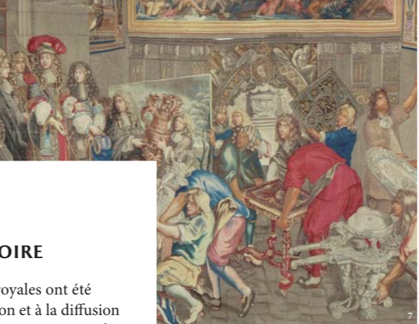
7. Le Roy Louis XIV visitant les Manufactures des Gobelins..., 13 e pièce de la tenture de l'Histoire du roi, d'après Charles Le Brun